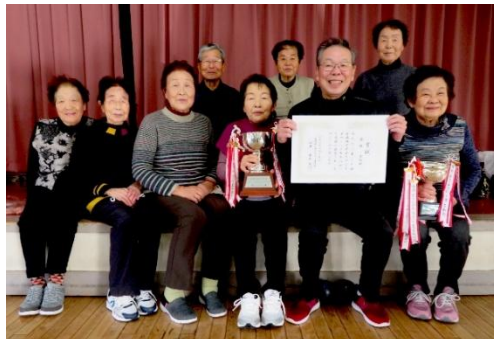
優勝を喜ぶ青柳チームの皆さん